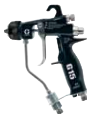
Pistola asistida por aire G15™/G40™