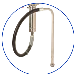
Manguera de succión