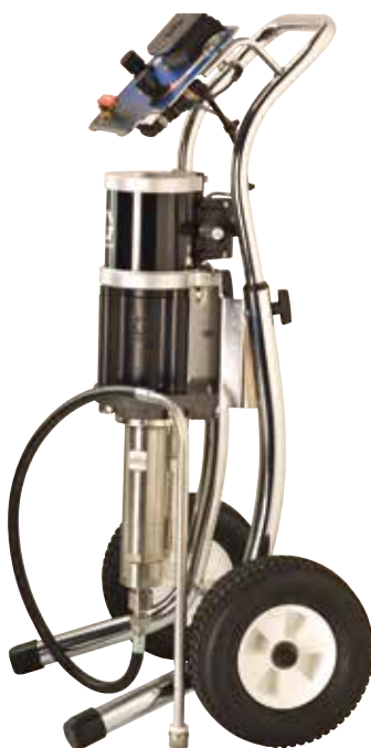
Montaje en carro