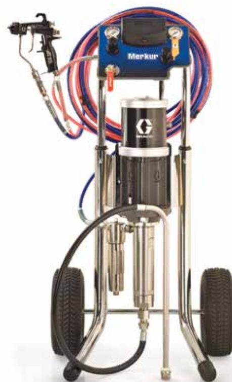
Paquete de carro asistido por aire