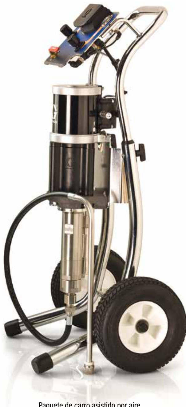
Paquete de carro asistido por aire