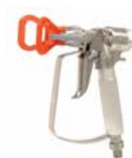
Pistola sin aire XTR™