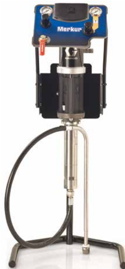
Paquete en soporte asistido por aire