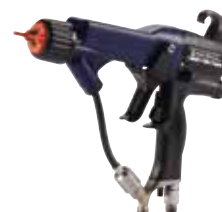
Electrostática asistida por aire Pro Xp™