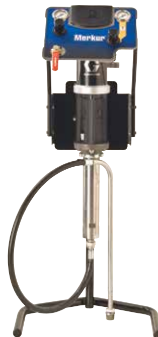
Montaje en soporte