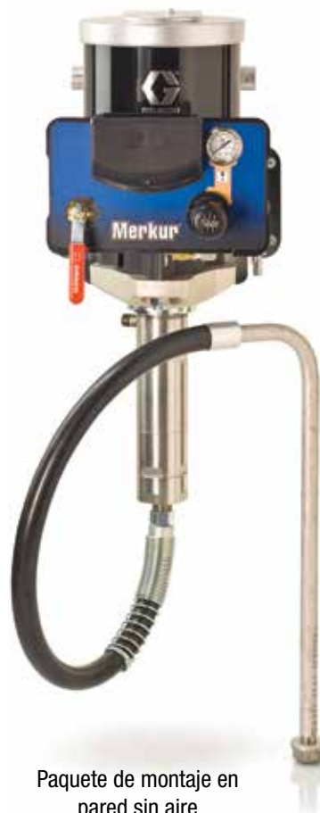
Paquete de montaje en pared sin aire

*Todos los paquetes tienen una manguera de fluido y aire de 25 pies (7,5 m)