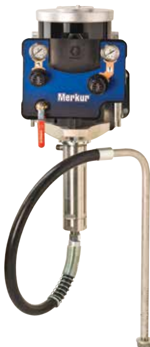
Montaje en pared