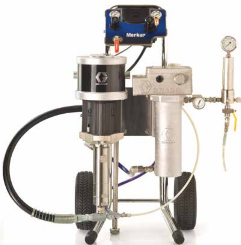
Paquete de carro térmico asistido por aire

*Todos los paquetes tienen una manguera de fluido de 25 pies (7,5 m)